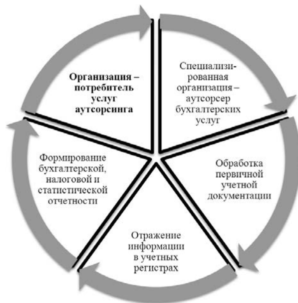
Рис. 2. Схема организации бухгалтерского учета при передаче на аутсорсинг

На наш взгляд, наиболее предпочтительным выглядит второй вариант, поскольку позволяет сохранить у заказчика чувство частичного контроля за ведением бухгалтерского учета и отчетности. Преимущество данного вида аутсорсинга для небольших организаций, по нашему мнению, очень значимо, поскольку позволяет сэкономить средства на содержание высококвалифици-